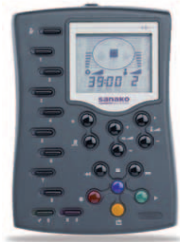
Sanako Lab 100 UAP User Audio Panel