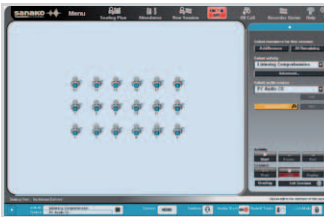
Sanako Lab 100 Lehreroberfläche

Das einzigartige und effektive Sprachlabor bietet ein innovatives Lernumfeld an, um Sprachfertigkeiten zu verbessern. Die digitalen Aufnahmeeinheiten und abwechslungsreiche Sprachlernaktivitäten involvieren alle Schüler gleichzeitig und garantieren sichtbare Lernerfolge.