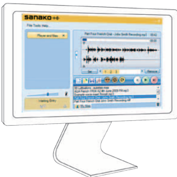
Sanako Study Oberfläche für Schüler