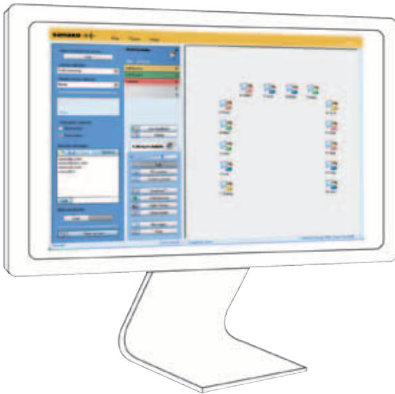
Hauptfenster des Lehrers in der Sanako Study Software

Sanako Unterrichtsprodukte finden in einer Vielzahl von Lernumgebungen ihren Einsatz – von reinen Sprachlaboren bis hin zu sprach- und fächerübergreifender Unterrichtssoftware und Klassenzimmer-Management-Lösungen.